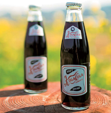
鉱泉水を使った炭酸飲料「コガ・コーラ」はレトロな瓶もかわいいご当地ドリンク。