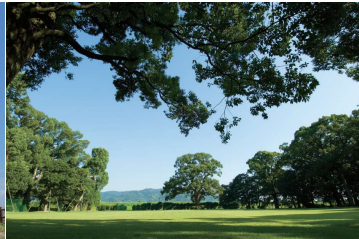
中ノ島公園 矢部川沿岸にある自然いっぱいの公園で、夏は子どもたちの水遊び場になるなど、地域の人々の憩いの場として親しまれています。国指定天然記念物の大きな楠林が広がっています。