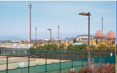
県営筑後広域公園 船小屋中ノ島エリアを中心に東西4kmにわたって整備された、県内で最も広い県営公園。「豊かさを体感できる施設」がテーマで、さまざまなスポーツ・文化施設などが揃っています。