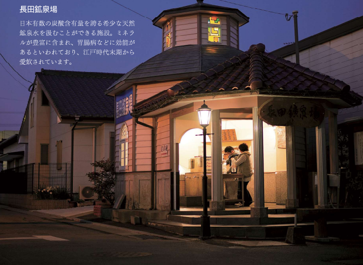
長田鉱泉場 日本有数の炭酸含有量を誇る希少な天然鉱泉水を飲むことのできる施設。ミネラルが豊富に含まれ、胃腸病などに効能があるといわれており、江戸時代末期から愛飲されています。