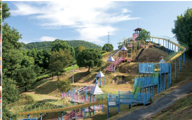
高田濃施山公園 自然豊かで広々とした総合公園。東濃施古墳を中心に、全長約100mのローラー滑り台がついたコンビネーション遊具や、キャンプ場、BBQ広場、バタールゴルフ場もあります。