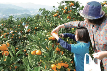
山川みかん狩り 全国的にも有名な山川みかん。収穫の季節になると山一面がオレンジ色に染まるほど。さわやかな甘い香りが漂う中、有明海や盤仙を眺めながら、多くの人がみかん狩りを楽しんでいます。