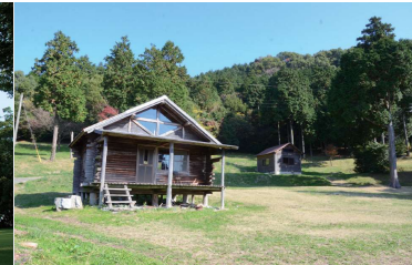
お牧山公園キャンプ場 市の最高峰(405m)の山頂から市内が一望できる素晴らしい眺望と、美しい自然が魅力。バンガローや炊事場があり、キャンプやBBQが楽しめます。こどもが遊べるアスレチック遊具も。