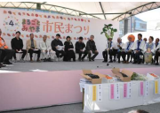
まほろこみやま市民まつり