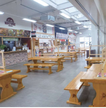
道の駅みやま 地元産の採れたて野菜や果物、有明海の鮮魚や加工品などが購入できる特産品直売所。充実のフードコートと休憩スペースもあり、連日多くの人で賑う人気スポットです。観光案内所も併設されています。