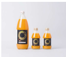
山川みかんジュース

瀬高・高田の大豆で、昔ながらの製法で丹精込めて手作りました。保存料などの添加物は不使用。ほのかに甘い、ほっとする優しい味です。