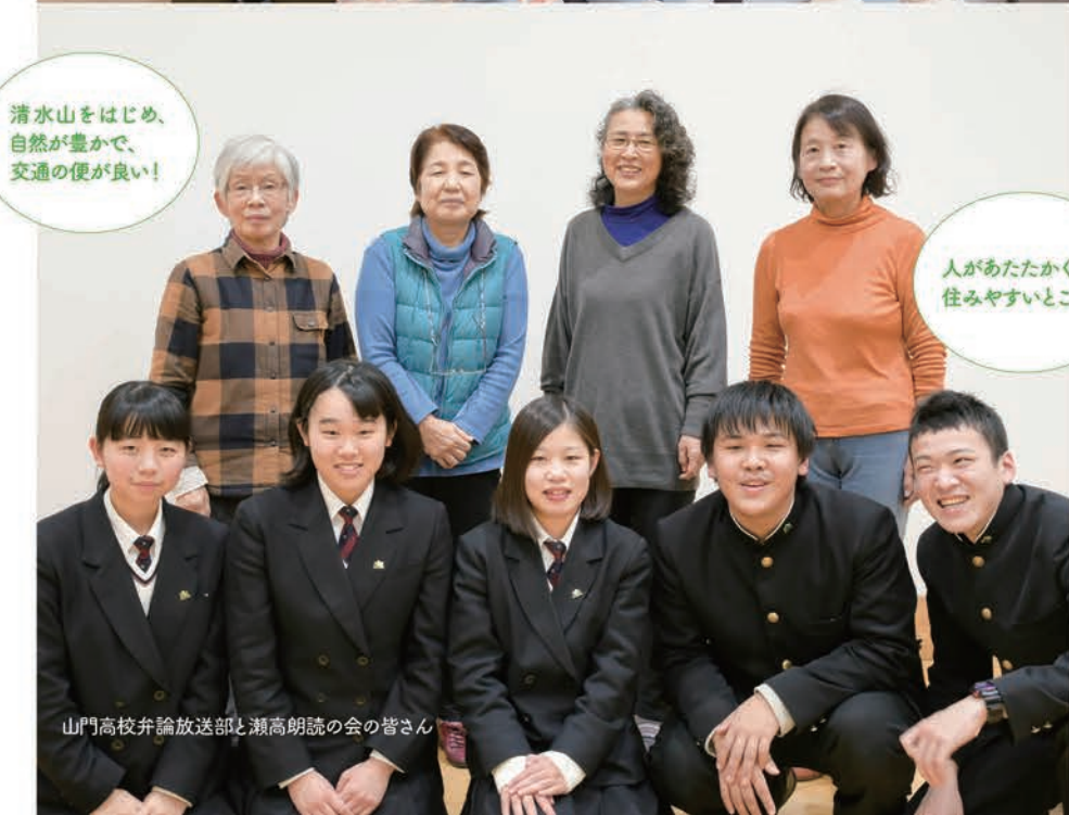
山門高校弁論放送部と瀬高朗読の会の皆さん

赤ちゃんからお年寄りまで、誰もがいきいきと輝いている。そんな「みやまライフ」を支えているのは、優れた子育て環境に、地域の特徴を生かした教育、安心の福祉サービスや安全に生活できる防災対策など、充実したサポートの数々。