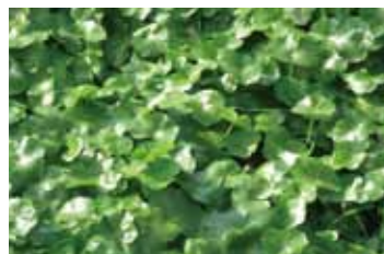
▲ブラジルチドメグサ

近年、市内の水路にブラジルチドメグサが繁殖しています。ブラジルチドメグサは特定外来生物に指定されており、生態系に影響を及ぼす恐れがあります。市では地域住民の方からの情報提供や職員による巡回により、できる限りの発見・除去に努めておりますが、広範囲に繁殖するため、完全には除去ができていない状況です。完全に除去するには、小さいうちに除去することが効果的です。秋口から冬場にかけては繁殖力が弱まり、小さくなっているものも見られますので、人力でも除去しやすい状態です。建設課では、除去の際に必要な道具の貸し出しを行っています。地域での清掃活動などの機会に除去へのご協力をお願いします。※水路から除去したブラジルチドメグサは、通行の支障にならないように水路畔などに捨ててください。