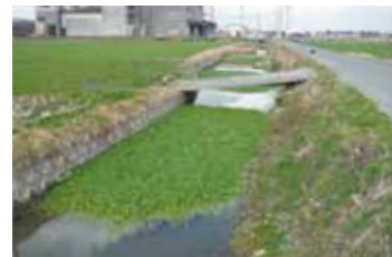
▲繁茂している水路の様子