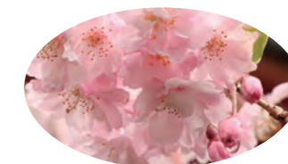
みやま市山川町立山 1278 番地 山川支所別館 (Tel 32-9179)