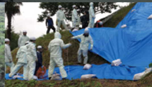
▲シート張りを行う消防団員