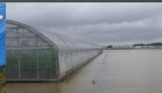
▲農作物も被害を受けました