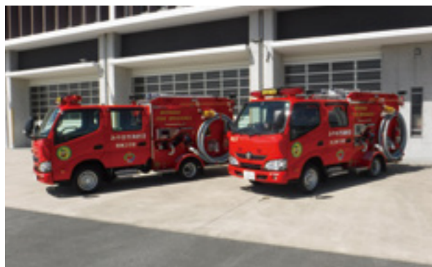
▲9月13日に車両引き渡しが行われました

市消防団の消防ポンプ自動車2台を更新しました。今回更新したのは、南第2分団および水上第1分団の消防ポンプ自動車です。新しい車両は、みやま市消防団として初の3.5ト未満の消防ポンプ自動車（普通自動車免許対応）で機動性と機能性を兼ね備えており、消火活動やさまざまな災害に対応できるものです。さらなる消防力の維持・強化が期待されます。