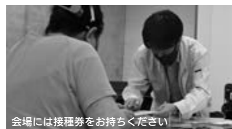
会場には接種券をお持ちください