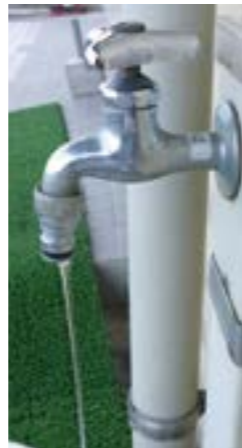
▲蛇口から一筋の水が出ている状態