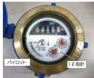
パイロット 1分指針 市ホームページ