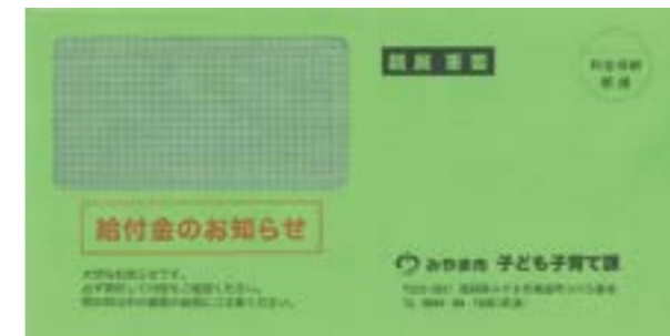
送付された封筒には「給付金のお知らせ」と記載されています

18歳までの子どもを養育している、所得が児童手当(特例給付を除く)の所得制限限度額未満の人に、子ども1人あたり10万円を現金で支給しています。申請が不要な人には昨年の12月27日に指定口座に振り込みしました。申請が必要な人は、3月31日までに必ず申請ください。 ■支給対象 ①令和3年9月分の児童手当受給者②高校生世代(平成15年4月2日〜平成18年4月1日生まれ)を養育する人③令和4年3月31日までに生まれる新生児の保護者 ■申請方法 ①は申請不要(振り込み済) ②③と公務員世帯は申請が必要 申請が必要な場合 申請が必要な人のうち、市が把握している世帯には12月末、下記の緑色の封筒で申請書を郵送しました。申請書が届いていない場合は子ども子育て課に連絡して、申請書を取り寄せてください。 昨年10月1日以降に当市に転入した人は、9月30日時点で住民票があった市町村に問い合わせください。