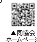
▲同協会ホームページ

ととなった日から1年以内の人 ▼受付期間=9月5日(月)~26日(月)(消印有効)▼申込先=(公社)福岡県危険物安全協会▼申請書配布場所=みやま市防災協会事務局(市消防本部予防課内)▼講習会には、危険物取扱者免状をお持ちください▼講習日程の詳細やオンライン講習については、(公社)福岡県危険物安全協会ホームページをご覧ください 同協会ホームページ(Tel.62・5993)