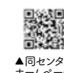
▲同センターホームページ

【ひとり親家庭への就業支援】 【パソコン資格取得講座】▼期間=10月12日(水)~11月9日(水)までの水曜・金曜(計8日間)。各午後6時30分~9時▼場所=男女平等推進センター(久留米市諏訪野町)▼定員=7人▼受講料=無料(教材費など5310円は自己負担)▼申込期限=9月27日(火)▼託児あり 久留米ひとり親サポートセンター(Tel.0942・32・1140) 【久留米大病院福岡県肝疾患相談支援センター公開講座(無料)】 ▼内容=新時代の肝臓治療▼日時=10月15日(土)午後1時~4時30分▼場所=久留米大学旭町キャンパス水館イベントホール(久留米市旭町)▼申込期限=10月2日(日)▼先着250人▼10月29日(土)~11月4日(金)の期間、YouTubeで配信します▼申込方法など詳しくは問い合わせください 同センター(Tel.0942・31・7968)