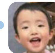
ごうけんちゃん (瀬高町)