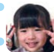
ななみちゃん (瀬高町)

掲載希望者は、写真を3歳児健診時または市役所(本庁)子ども子育て課へお持ちください。