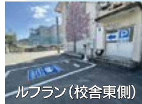
ルフラン(校舎東側)