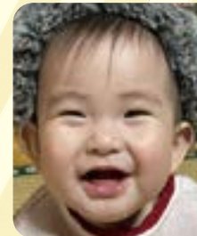
すい 東 吹ちゃん 4月27日生まれ (瀬高町)