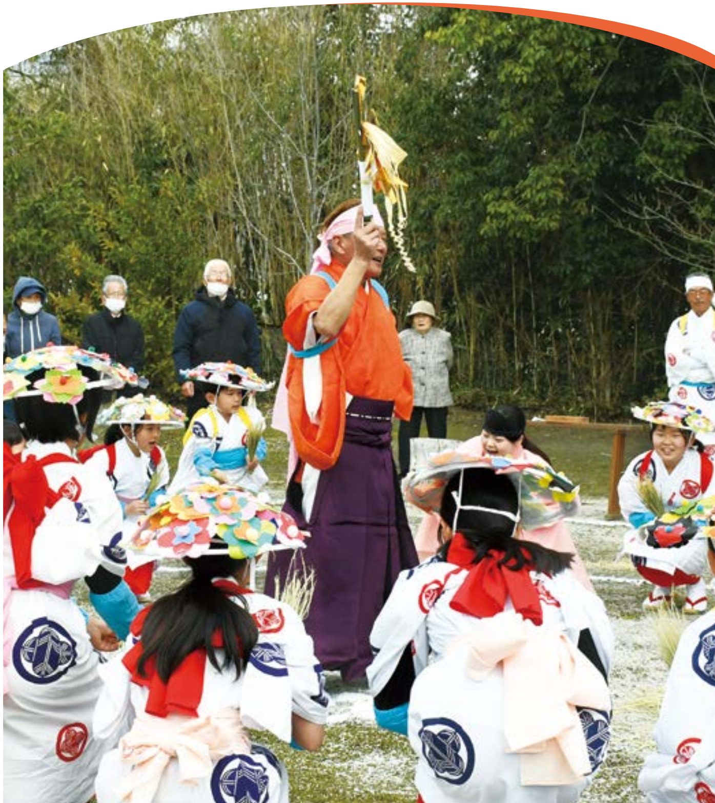
3月3日、筑後乃国阿蘇神社で海津御田植祭が行われました(関連記事11頁)。