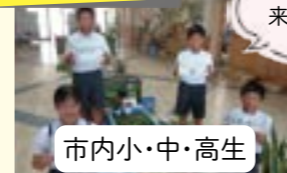
市内小・中・高生