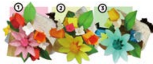
『ガザニアのミニブーケ』(中級者向け)