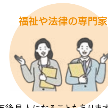
福祉や法律の専門家