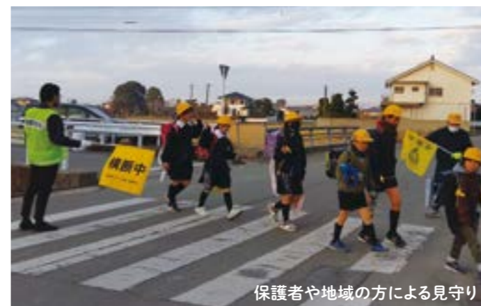
保護者や地域の方による見守り

子どもたちが安心して登下校できるよう、保護者や地域の方による見守り、イノシシ出没情報などが出た際の現地確認や注意喚起など、さまざまな取り組みが行われています。また、学校・警察・道路管理者などで構成する「みやま市通学路安全推進会議」では、年に1回通学路の合同点検を実施しています。