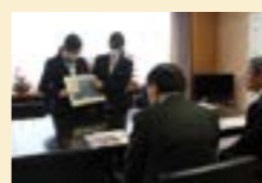
▶Oneヘルスクラブの活動報告