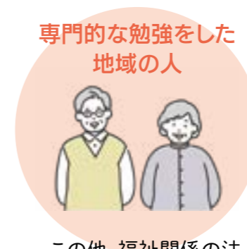
専門的な勉強をした地域の人