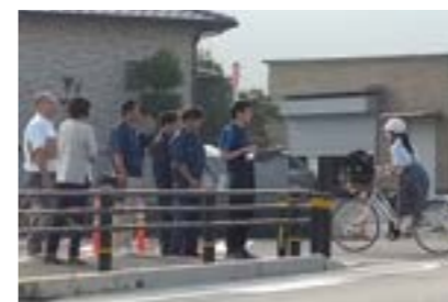
登校時の様子を合同点検

これらの報告を受け、協議・現地調査を行い、線の塗り直しや信号機設置の検討、通学路の変更などの安全確保に取り組んでいます。