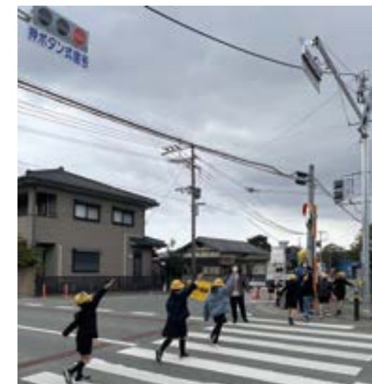
設置翌日、清水小学校の全校児童が、信号機の使い方や横断歩道の渡り方などを学びました

多くの市民の皆さまからご要望のありました本吉交差点に、新たに信号機が設置され、1月28日に利用が開始されました。