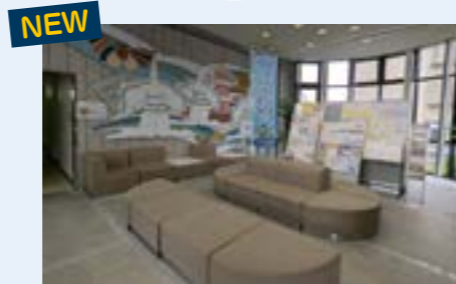
JAみなみ筑後本店(ロビー)