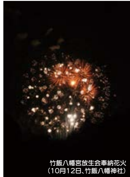
竹飯八幡宮放生会奉納花火 (10月12日、竹飯八幡神社)