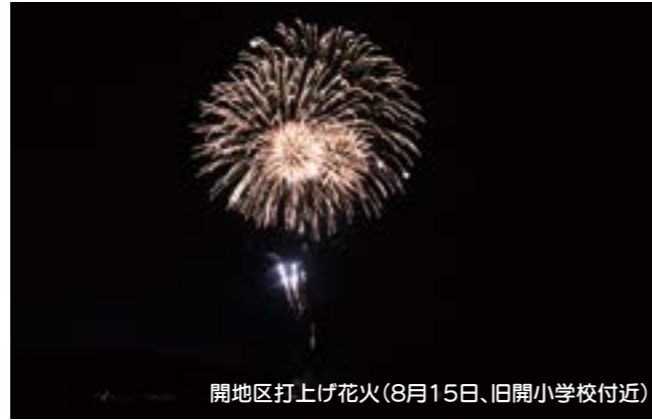
開地区打上げ花火(8月15日、旧開小学校付近)