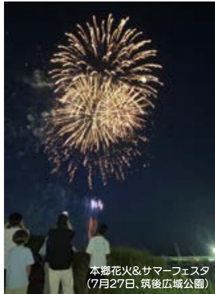
本郷花火&サマーフェスタ (7月27日、筑後広域公園)