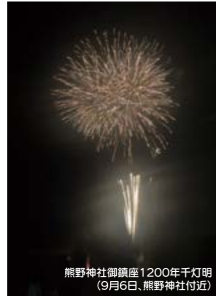
熊野神社御鎮座1200年千灯明 (9月6日、熊野神社付近)

花火文化の継承と地域の活性化や賑わい創出を目的とした花火大会が、7月から10月にかけて市内5か所で開催されました。これは市の地域花火大会補助金制度を活用したもので、団体それぞれの工夫を凝らしたイベントで「花火のまち みやま」の空を彩りました。最後の花火が打ちあがると会場は大きな拍手と歓声に包まれ、観覧に訪れた人々からは、「久しぶりに家族や友人と一緒に夜空を見上げ、笑顔になれる時間を過ごせました。」「花火大会があると子どもたちが楽しみにして、地域に活気が出ます。」などの声が聞かれました。