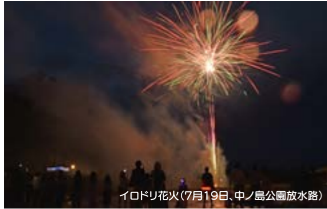
イロドリ花火(7月19日、中ノ島公園放水路)