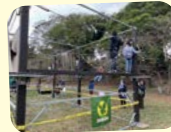
移動アスレチック