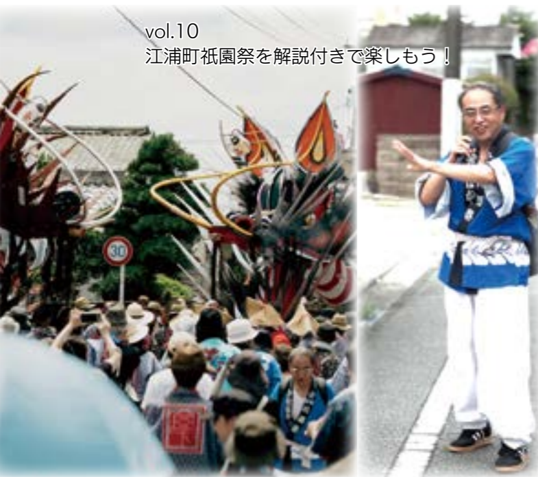
vol.10 江浦町祇園祭を解説付きで楽しもう！