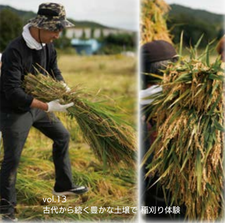
vol.13 古代から続く豊かな土壌で 稲刈り体験

や自然との共生も含め、みやまですぐらすことの「価値」を見つめなおし、質を高め続けていく「深化」だと考えています。 「競争」ではなく「共奏・共創」、先に進める「進化」ではなく質を深める「深化」、そして、いにしえから育まれ根付いてきた共生やもやいの心の素晴らしさを改めて感じ、共に分かち合うことで、「みやまの共奏・深化」を実現していきたい。それが、本市の目指すシティプロモーションです。