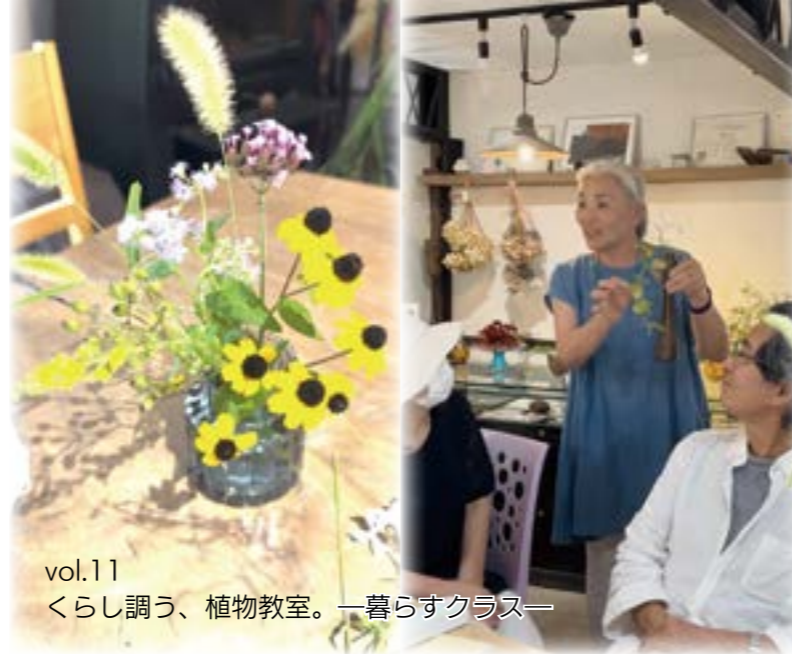
vol.11 くらし調う、植物教室。一暮らしクラス