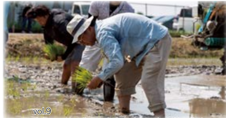
vol.9 古代から続く豊かな土壌で 山門の米 田植え体験