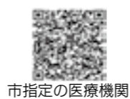
市指定の医療機関

予防接種法で定められた「定期予防接種」は、接種対象年齢内であれば無料で接種できます。接種場所は市指定の医療機関や、県内の実施協力医療機関などです。事前に医療機関へ問い合わせの上、母子健康手帳を持参してください。