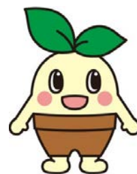
みやま市マスコットキャラクター くすっぴー