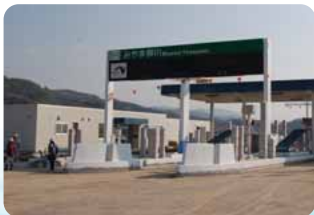
みやま柳川インターチェンジ