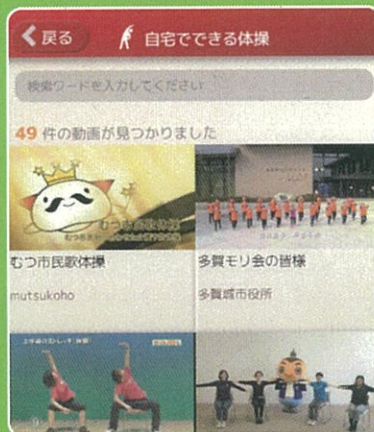
自宅で出来る体操動画 画面イメージ