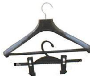
金具付きハンガー