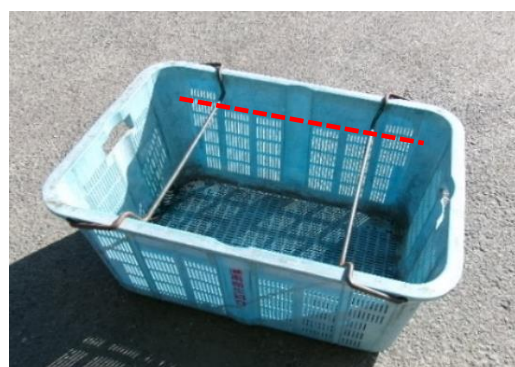
サイズ（内寸）約 69cm×44cm×30 cm