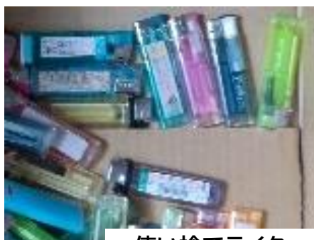
使い捨てライター