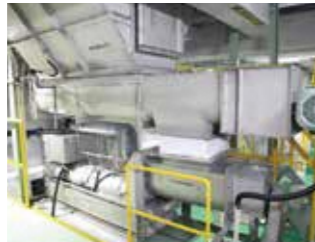
生ごみ破碎分別装置