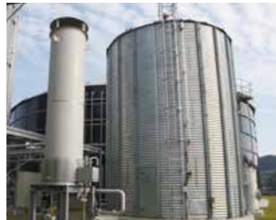
ガスホルダ・余剰ガス燃焼装置