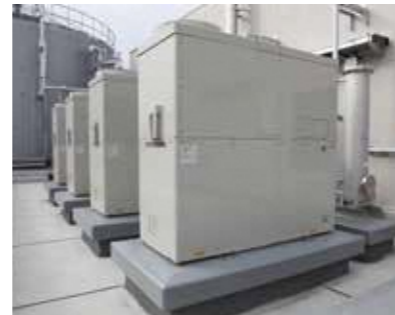
バイオガス発電機