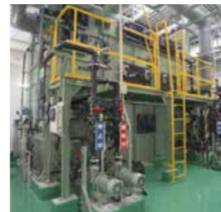
生物脱臭塔・薬液脱臭塔