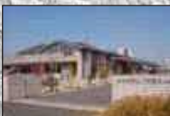
③山川市民センター