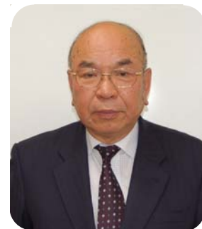
みやま市長 西原 親

本市は、平成 19 年 1 月 29 日に瀬高町、高田町、山川町が合併して生まれた新しい都市で、3 町から受け継いだ豊かな自然や歴史文化等の地域資源が数多く存在しており、市民だけでなく来訪者の方々の心も癒してくれます。