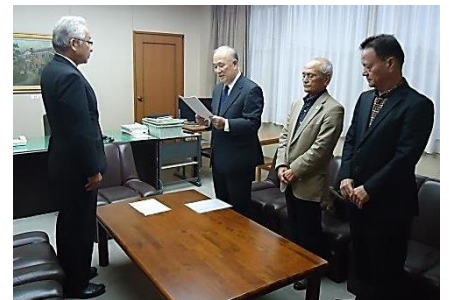
藤木会長から教育長職務代理者へ答申する様子