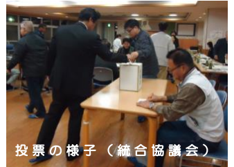
投票の様子（統合協議会）

応募された129件の校名の中から、教育委員会で絞り込まれた7つの校名候補について、総務部会で投票を行い、『柎桜』、『瀬高』、『矢部川』を選定しました。さらに、第3回統合協議会においてこの3案で投票を行った結果、過半数の票を獲得した『瀬高』が選ばれ、教育委員会の審議を経て、3月の定例市議会において学校設置条例が改正されました。