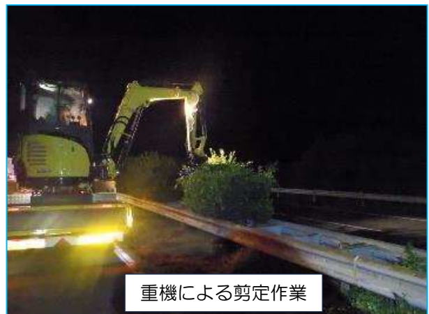
重機による剪定作業